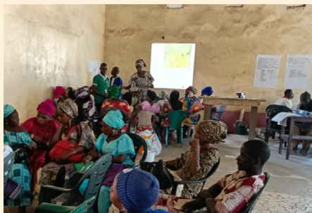
Foyer des jeunes à Ouonck

Il existe un foyer des jeunes à Ouonck. Le toit avait une fuite : le comité a soutenu sa restauration. Les jeunes étudient la mise en place d'une sorte de centre socioculturel.