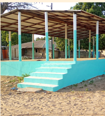
Tribune de Ouonck

La tribune est un peu comme un forum, un endroit où la population peut se réunir à l'abri de la pluie ou du soleil. Elle avait été endommagée par la saison des pluies. Le comité de jumelage de Bretteville sur Odon a financé sa réfection ; notre comité a quant à lui participé aux finitions avec les peintures. Elle est terminée !